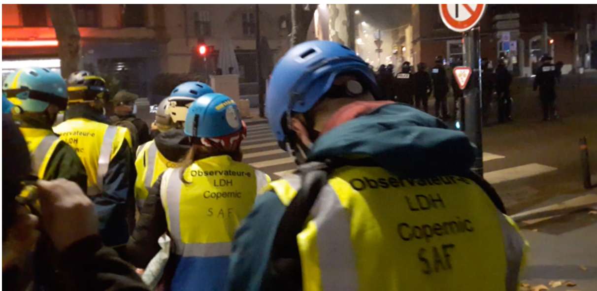
Les observateur-es en position après avoir subi un jet de grenade ciblée – Boulevard Carnot à Toulouse – 17 novembre 2020

Cette agression contre les observateur-es a conduit à une rencontre, le 31 mai 2018, avec la DDSP – Direction départementale de la sécurité publique et la préfecture lors de laquelle il a été décidé, d'un commun accord, que la présence des observateur-es serait systématiquement déclarée en préalable à toute observation des pratiques policières. A ce jour, depuis le 25 octobre 2018, près de 130 déclarations ont été envoyées en préfecture.